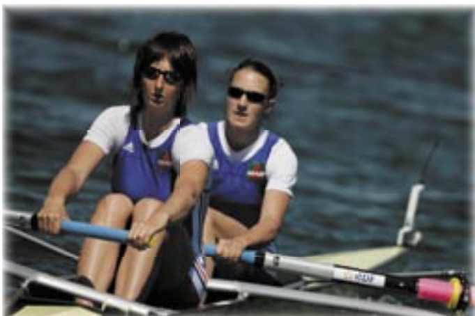
DEUX DE POINTE SANS BARREUSE FEMME